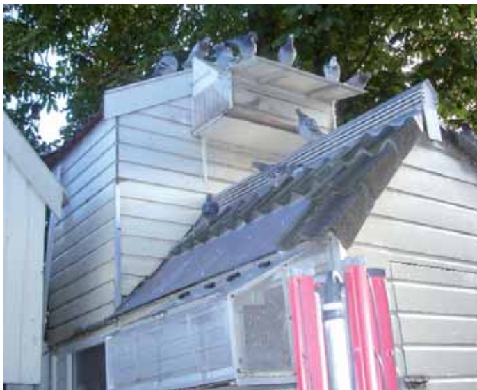
Det andet slag - også delvis ovenpå et udhus.

Barcelona er og bliver Barcelona – den vigtigste kapflyvning for de brevduemænd i Frankrig, Belgien, Holland og Tyskland, som går ind for maratonflyvninger. Nogle år deltager der også enkelte duer fra andre lande, men interessen er helt sikkert størst i Belgien og Holland. De sidste 10 år har der internationalt fra Barcelona del-