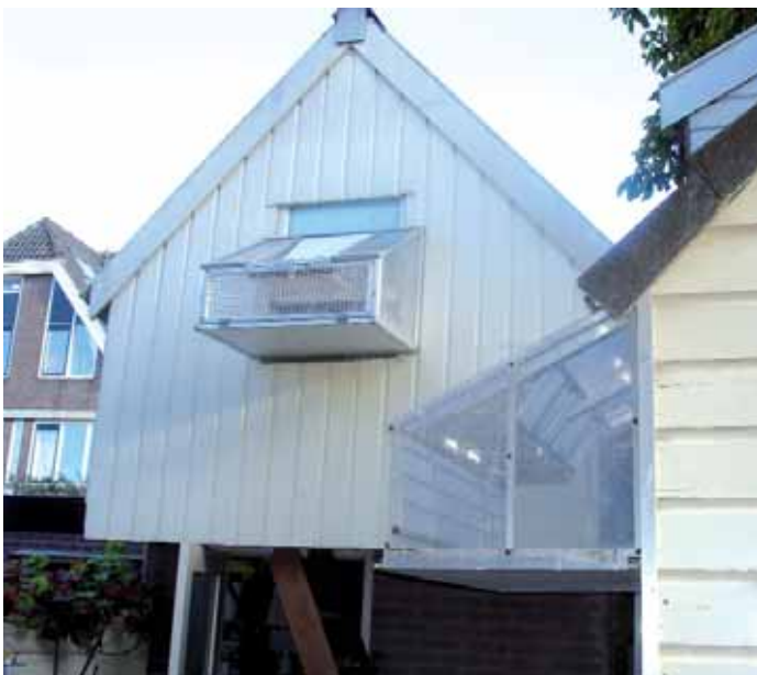
Det ene slag ovenpå udhuset.