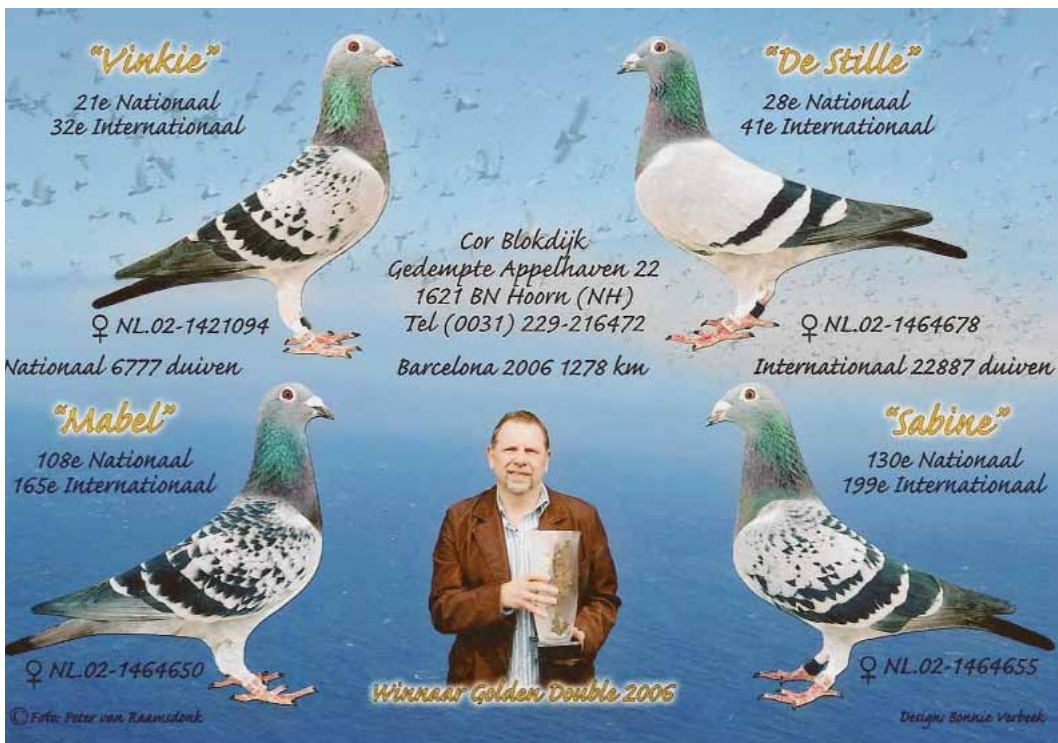
De 4 topduer fra Barcelona 2006